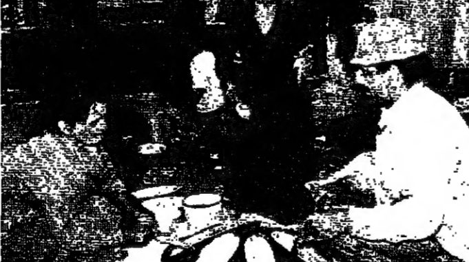
قداس في مجدل العاقورة

اجتمع في مجدل العاقورة في بلدة العاقورة جنوب شرق بيروت من اجل صلاة القداس التي أقامها المطران الراعي اسكندر غبريل في رعية العاقورة.